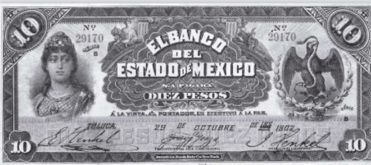
在米中の大山助一が肖像を彫刻したお札 メキシコ 10ペソ 1898~1912年