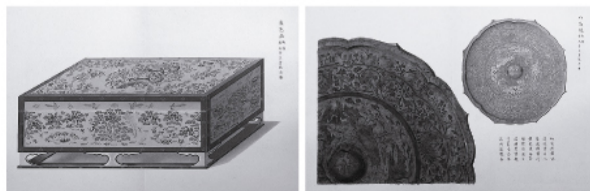
乙100円の図柄の元となった『国華余芳』(正倉院御物)