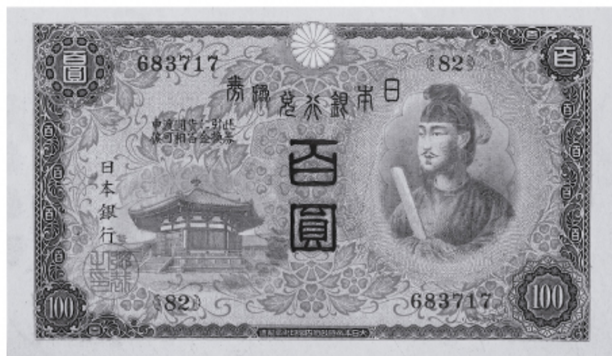
日本人が初めて肖像をデザインしたお札 日本銀行兌換券 乙100円 昭和5(1930)年

本展では、お雇い外国人から学んだ技術を日本の技術者たちが自ら成熟させ、生粋のお札を生み出すまでの軌跡を同時代の海外紙幣や関連資料と併せてご紹介します。