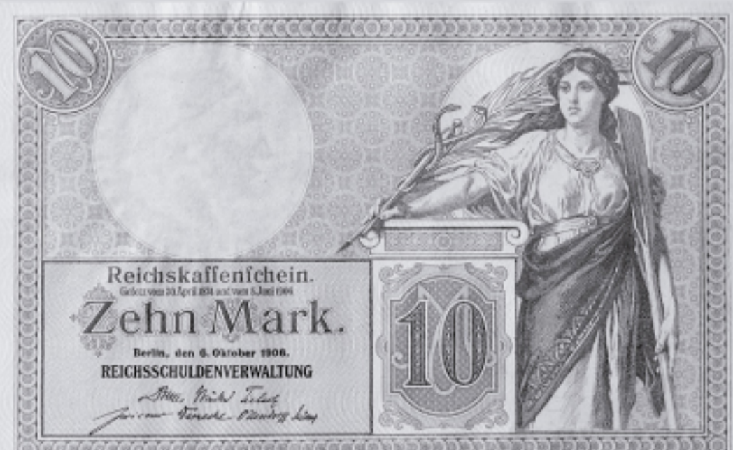
ドイツ 10マルク 1906年