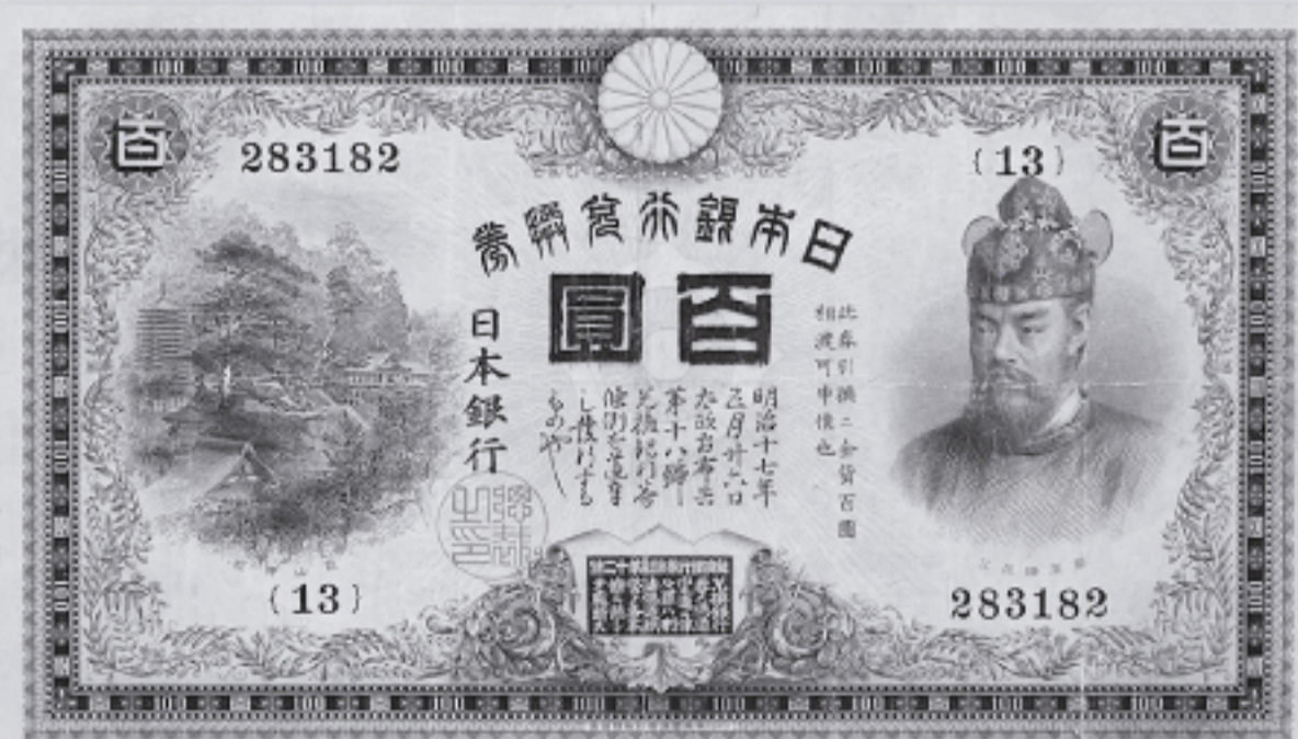
アメリカで技術を研鑽した大山助一が肖像を彫刻したお札 日本銀行兌換券 甲100円 明治33(1900)年