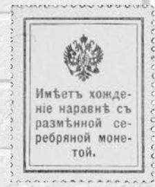
ロシア 10 カペイカ 1915 年

このお札にはなんと書いてあるんだろう？ これはそもそもお札なの？ お札の裏に隠された謎を解き明かそう。