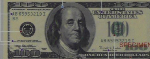
アメリカ 100ドル 1996年 66×156 mm