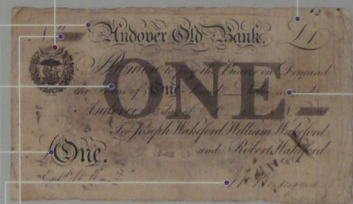
イギリス 民間銀行券 1ポンド 1823年 113×195mm