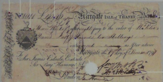
イギリス 為替手形 40ポンド10シリング 1798年 115×225mm