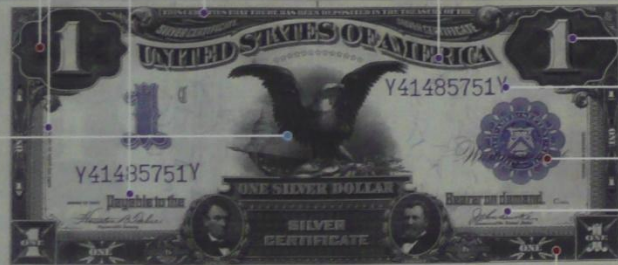
アメリカ 銀証券 1ドル 1899年 79×189 mm