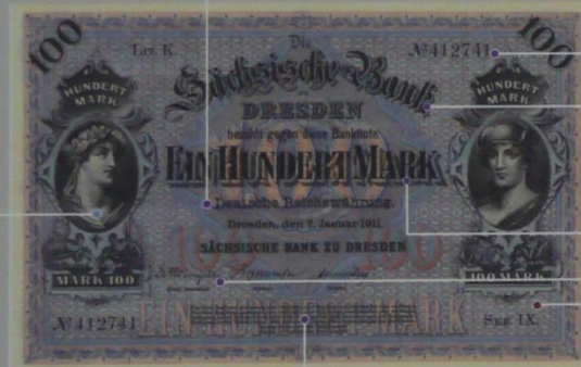
ザクセン王国(ドイツ) 100マルク 1911年 102×159 mm

ます。この様式は、アフリカ諸国などに広まりました。日本のお札も、明治 時代の初めにこの様式を取り入れました。なお、アメリカ系はヨーロッパ 系よりも横長ですが、20世紀半ば以降、アメリカ系とヨーロッパ系とも にお札が小さくなり、逆に、肖像は大きく描かれるようになってい