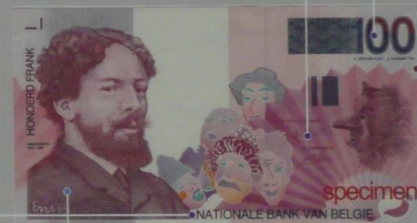
ベルギー 100フラン 1994年 76×139 mm

絵柄 肖像と絵 ベルギーの画家、ジェームズ・アンソールの 肖像と、その作品をデザイン化した絵