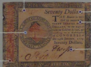
アメリカ 大陸紙幣 70ドル 1779年 70×92mm

一本の木の絵。その周りには、「3年間、嵐にたえた」と、独立戦争について書いてあります。