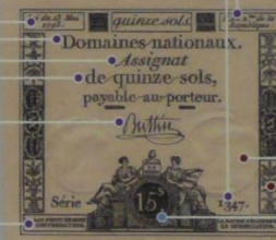
フランス アッシニア紙幣 15ソル 1793年 81×87mm

フランス革命の理想である「自由」を表す女性像や、革命政府がとなえた「人権宣言」の絵